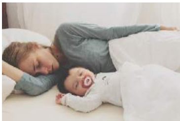
Dormir en même temps que le bébé

Il est important de donner confiance aux mamans et de les entourer (autre maman ou membre de la famille de préférence).